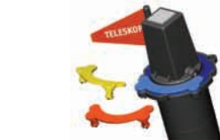
Beschriftungsstecker und Markierungsfahne