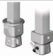
System-Schnellspannmuffe oder Systemmuffe