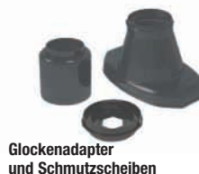
Glockenadapter und Schmutzscheiben