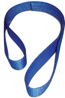
Hebebänder Typ A