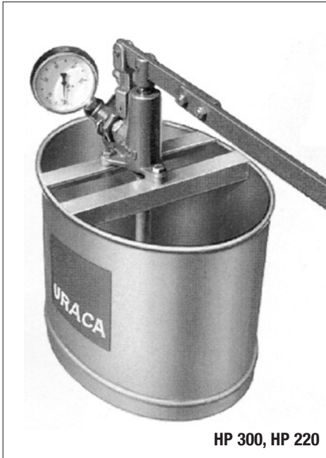
HP 300, HP 220